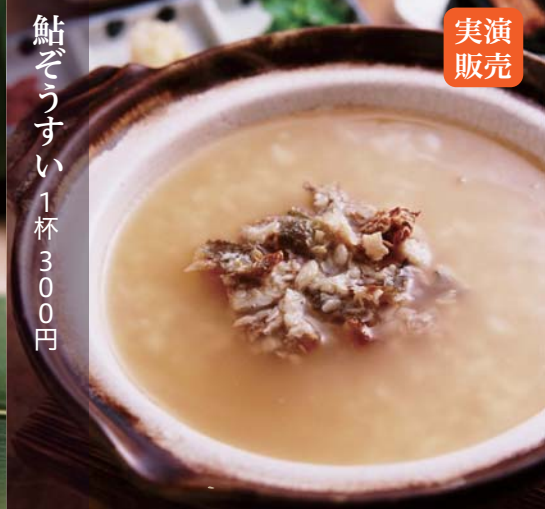
鮎ぞうすい 1杯 300円