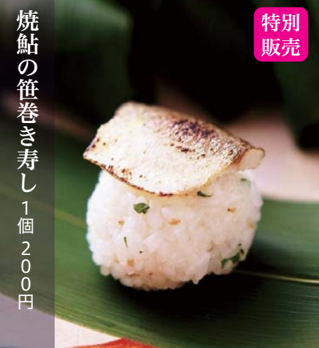
焼鮎の笹巻き寿司 1個 200円

実演販売 炭火焼・鮎塩焼 備長炭で約30分、頭から骨まで丸ごと食べられるようじっくり焼き上げます。1尾 500円