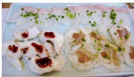
ウツボ(刺身、梅肉添え、コラーゲンの湯引き)

上五島・有川港から最終フェリーで約2時間半、佐世保に到着は19:00過ぎ。今宵は珍しい地魚と九十九島の牡蠣を目指して『櫻櫓(かいろう)』という寿司割烹へ。そこで、何と『ウツボ』を発見。まだ