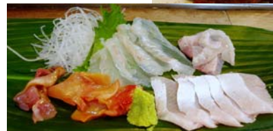
赤貝・ひらめ(縁側)・ヒラマサ(腹)